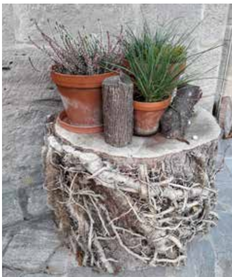
Beim Pilgern entdeckt