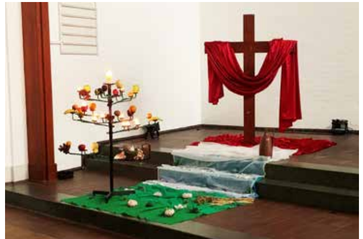
Ostern 2023: Installation in St. Johannis

Am Gründonnerstag, 28. März, erinnern wir mit einem Tischabendmahl an das letzte gemeinsame Mahl von Jesus mit seinen Jüngern: 18.30 Uhr, in der St. Pauluskirche. Am Karfreitag, 29. März, gedenken wir Jesu Tod in zwei Gottesdiensten: Morgens, 9.30 Uhr, in der Lutherkirche und nachmittags, zur Sterbestunde, um 15 Uhr, mit biblischen Texten und Gesängen aus der Gregorianik in St. Johannis. Am Ostersonntag, ab 5.30 Uhr, machen wir einen Osterspaziergang vom Neuen Friedhof zur Lutherkirche mit anschließendem Osterfrühstück. Unser Familiengottesdienst mit anschließender Ostereiersuche findet um 10 Uhr in der St. Pauluskirche statt. Am Ostermontag, 11 Uhr, feiern wir in der St. Johanniskirche einen Gottesdienst mit Abendmahl. ■