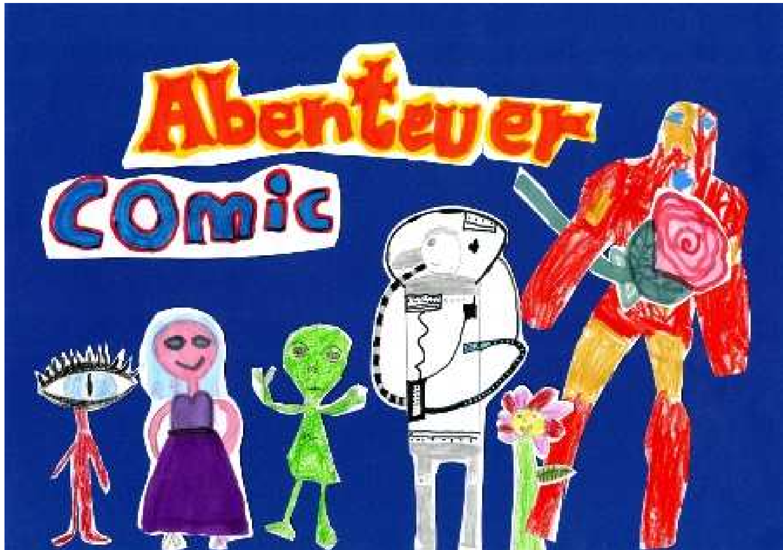
Ein Abenteuercomic von Adele, Alea, Aytana, Étienne, Helge, Lenn, Suela